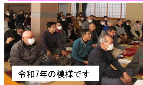
令和7年の模様です

町民の皆様、奮ってのご参加を何卒よろしくお願い申し上げます。 詳細は各戸配布の案内状を参照下さい。 ご欠席の場合は委任状を提出下さいませ。