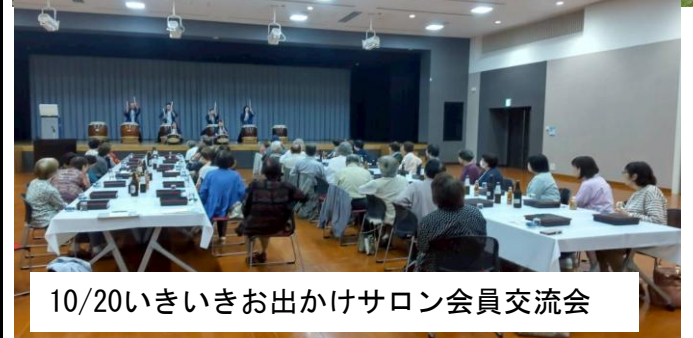
10/20いきいきお出かけサロン会員交流会