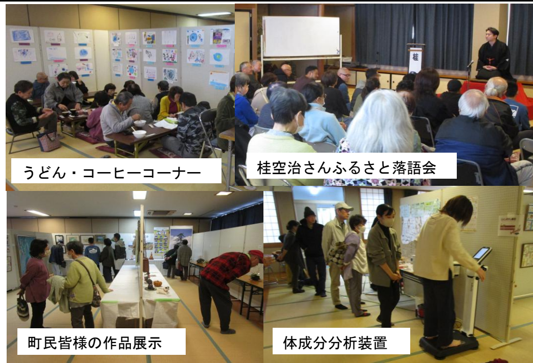
うどん・コーヒーコーナー

十月二十六日(日)福島町会館にて。二年に一度の開催です。たくさんのお品、ご来場を誠にありがとうございました。関係各位の皆様、お疲れ様でした。