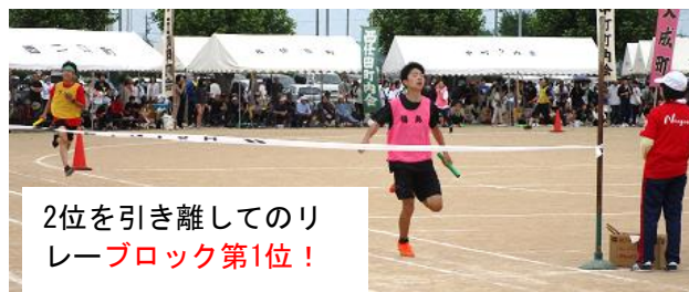
2位を引き離してのりレーブロック第1位!