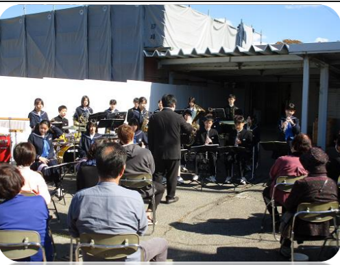
根上中学校吹奏楽部 コンサート風景

十月十二日(日)、福島町会館にて、福島町文化祭が開催されました。町の皆様、作品展示、うた、ヒーロー、ナーの復活、ステージとして、根上中学校吹奏楽部のコンサートが行われました。