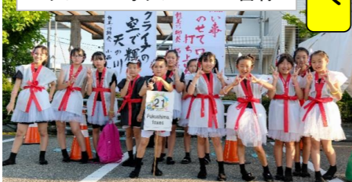
フクシマ・フォクシーズの皆様

七月二十二日(土)、小学生児童十二名で参加しました。残念ながら賞は逃しましたが、マスク無しの子供たちのイキイキとした笑顔を見る事が出来ました。少しづつ戻る日常を、とても嬉しく感じました。 (浜小PTA)