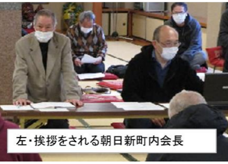
左・挨拶をされる朝日新町内会長

■一月二十四日(日) 十五時〜 福島町会館 本年の班長を務めていただく皆様にご集合いただき、班長のお仕事について、説明をさせていただきました。また、班からの要望を承りました。班長会は年三回の実施です。班長の皆様には、本年一年よろしくお願ひ申し上げます。