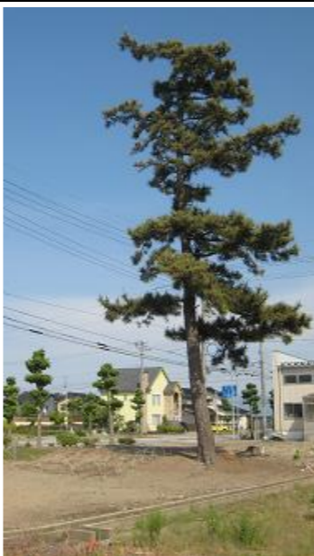
ここをお花いっぱい!