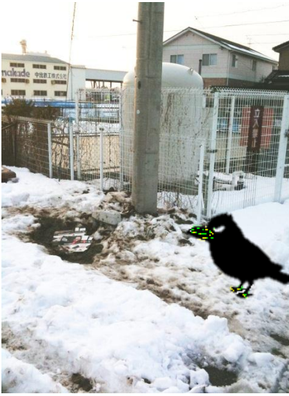
捨てたゴミ、いつもカラスが狙ってる

七班西でゴミのポイ捨てが時たまあります。ゴミは決められたゴミ袋を使用して、指定の収集場所へ指定の日に出すようにしましょう。捨てられたゴミを喜ぶのはカラスだけです。見かねた近所の方が片づけていますが、いつかは誰かが捨てているのかわらぬものです。その前に自覚してきちんとルールを守りましょう。